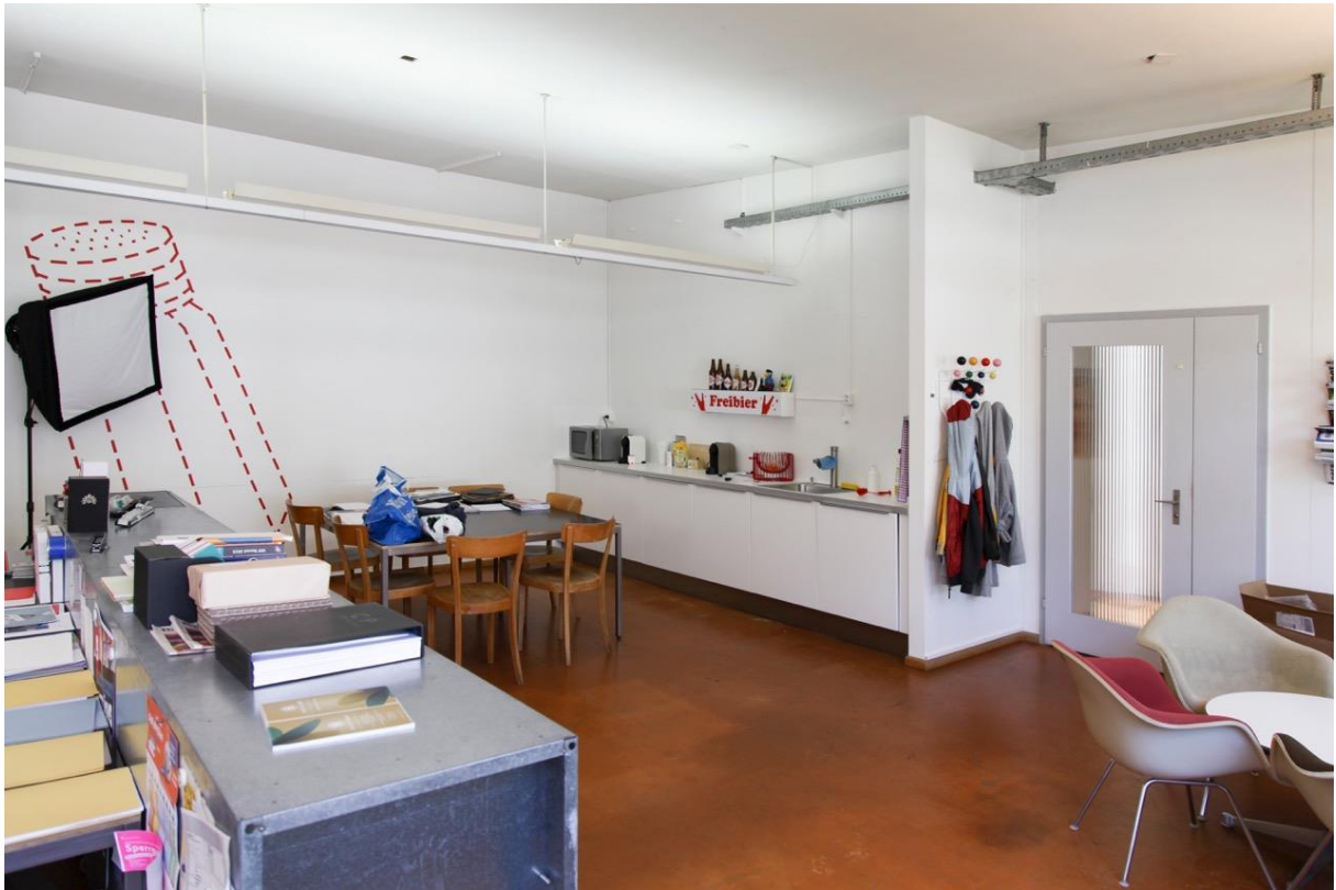
Bürraum mit Küche und Eingangstür