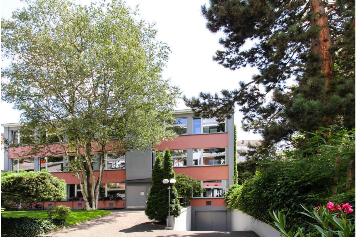
Ansicht Nordseite, Büroraum links oben 2.OG