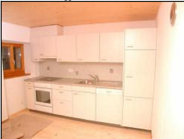
Cucina / Küche