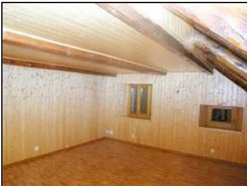
Camera / Zimmer