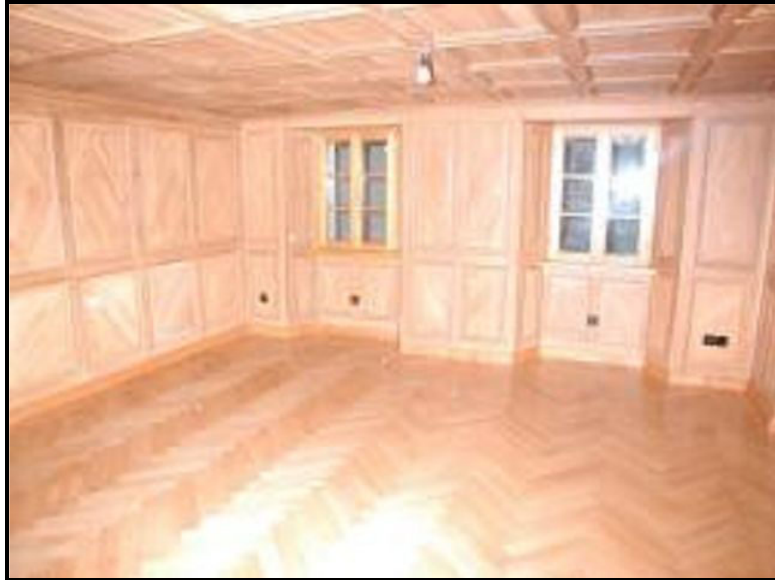
Soggiorno / Wohnraum