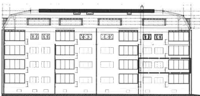
Fassade Süd-Ost - Strassenseitig - Massstab 1:300