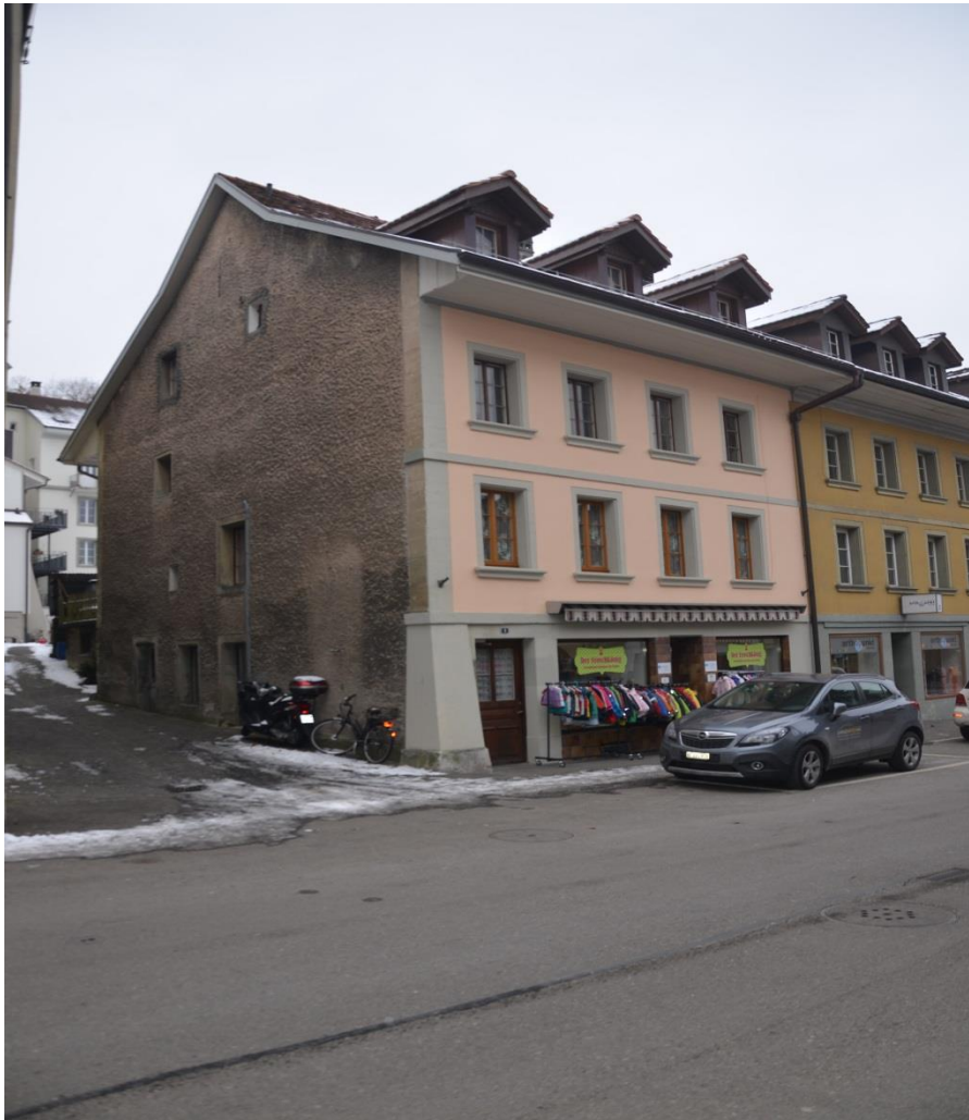
3 Familienhaus mit Ladenlokal Mühlegasse 1 3400 Burgdorf